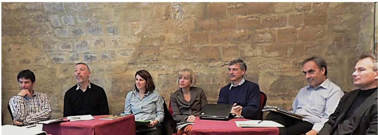
Fig. 1: PLANAT Mitglieder an der Sitzung vom 18. November 2014.

PLANAT est prioritairement chargée d'améliorer la prévention au niveau stratégique et d'assurer la coordination dans ce domaine. Cette commission est constituée de dix-huit spécialistes, nommés tous les quatre ans par le Conseil fédéral, qui représentent la Confédération, les cantons, les milieux de la recherche, les associations professionnelles, l'économie privée et les assurances. Le secrétariat de PLANAT est rattaché administrativement à l'Office fédéral de l'environnement (OFEV).