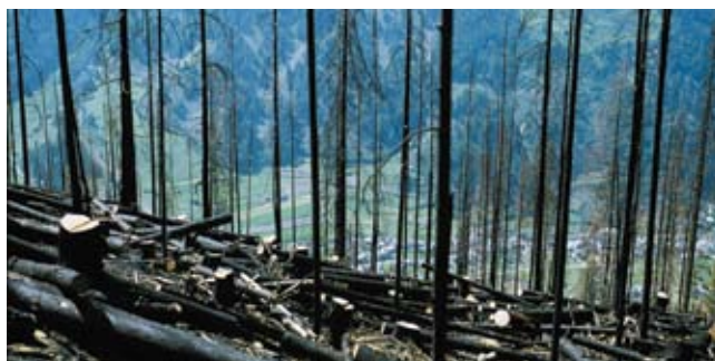
Incendio boschivo di Müstair, 27 luglio – 12 agosto 1983; lavori di sgombero