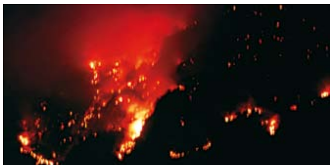
Incendio boschivo Mesolcina / Val Calanca, 16 – 30 aprile 1997