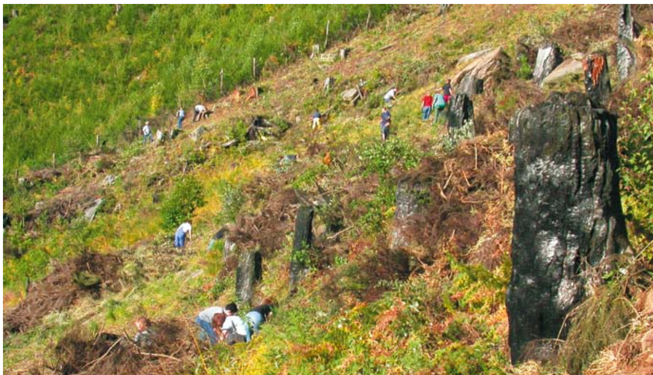
Incendio boschivo Mesolcina / Val Calanca, 16 – 30 aprile 1997; superficie bruciata boschivo Sta. Maria i.C.; lavori di cura 2004

Negli ultimi anni, in seguito al surriscaldamento climatico, gli incendi boschivi sono aumentati anche nell'Europa centrale. Dall'inizio del nuovo millennio, in particolare, i periodi estivi del 2003 e del 2006 nonché l'eccezionale primavera del 2007 hanno mostrato che un periodo prolungato di siccità con temperature più elevate della media porta a un aumento molto critico del pericolo di incendio. Si sottovaluta il fatto che precipitazioni limitate non possono praticamente allontanare il pericolo di incendi boschivi e per la maggior parte portano solo a una breve tregua fuori dal bosco. Nel bosco, solo abbondanti piogge riescono ad attraversare le cime degli alberi. Affinché il terreno del bosco sia di nuovo umido a sufficienza sono necessari diversi giorni di pioggia continua.