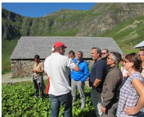
Fig. 3: Excursion au Val Piora