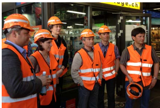
Fig. 4: Diskussion zum Thema „Angestrebtes Sicherheitsniveau und Schutzziele am Beispiel der Sihl“ beim Besuch der SBB-Baustelle am HB Zürich. Discussion à propos du niveau de sécurité visé et des objectifs de protection à l'exemple de la Sihl, lors de la visite du chantier des CFF à la gare principale de Zurich.